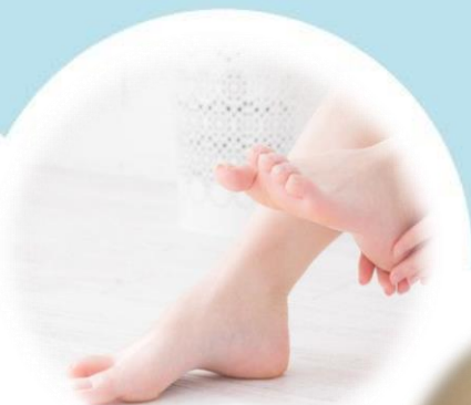
選べるケアメニュー