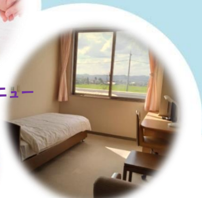
健康管理センター ママの居室 ゆっくり ひとり時間・