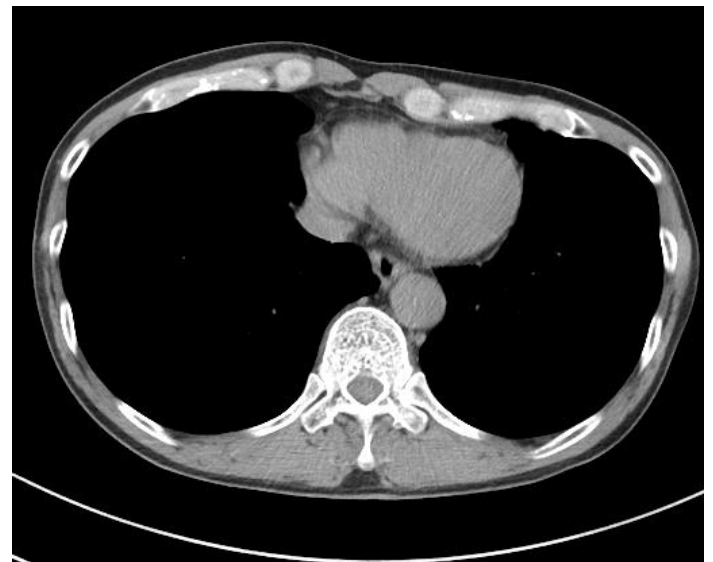
図 2 肺内リンパ節 胸部単純X線CT（縦隔条件）