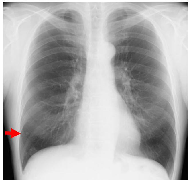
図 4 肺内リンパ節 胸部単純X線写真