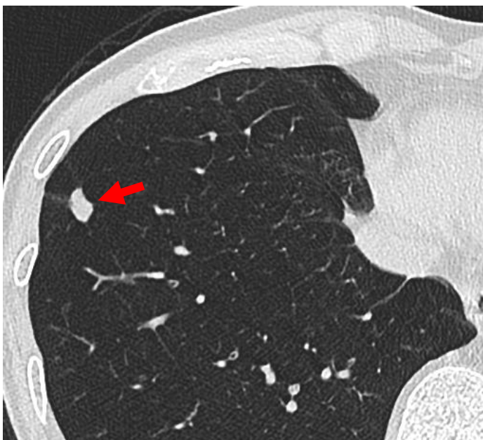
図 3 肺内リンパ節 胸部単純X線HRCT（肺野条件）