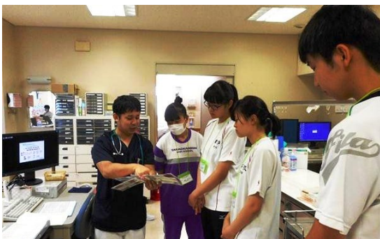
ナースセンターで説明をうける高校生

高校生が看護業務と看護についての理解を深め、看護職への進路選択の参考に資することを目的とし、公益社団法人富山県看護協会が主催となり、実施されました。県内22病院が見学病院となり、850名の生徒が対象となります。当院でも、7月3日（水）、12日（金）に計15名が「一日看護見学」を実施しました。