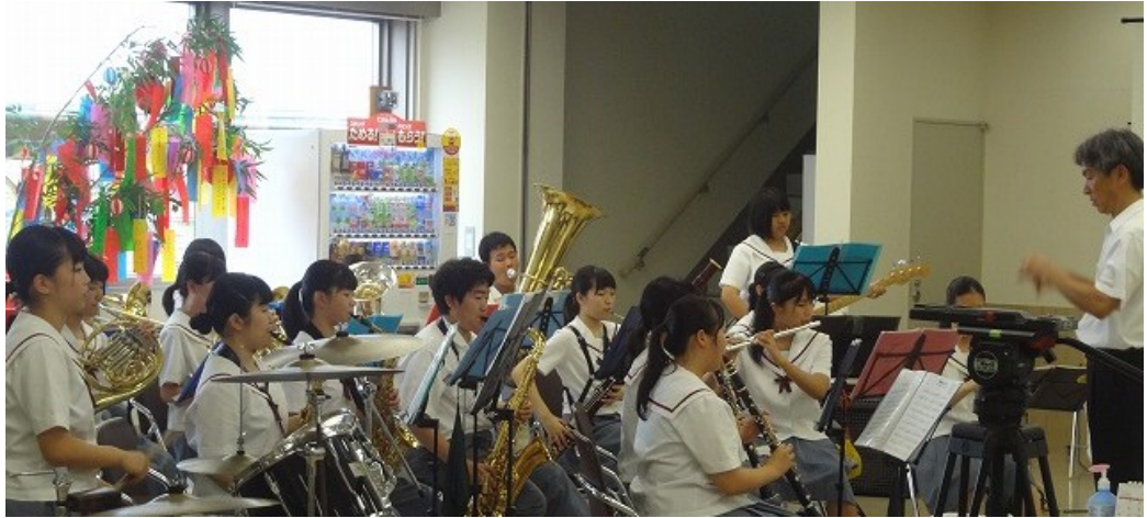
石動高等学校吹奏楽部のみなさん