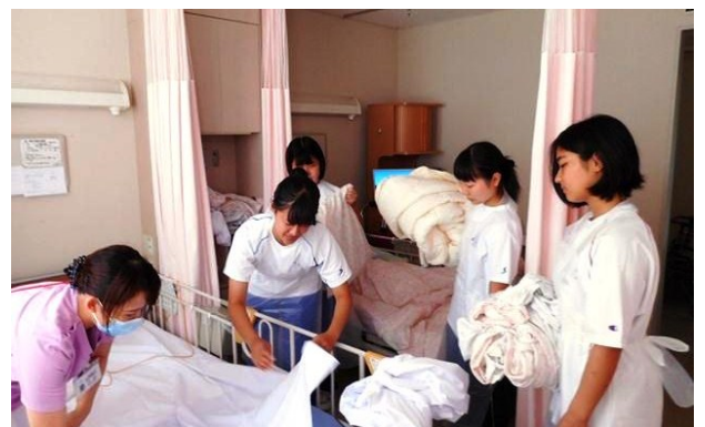
病棟でのシーツ交換体験