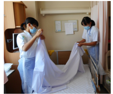
病棟でのシーツ交換体験