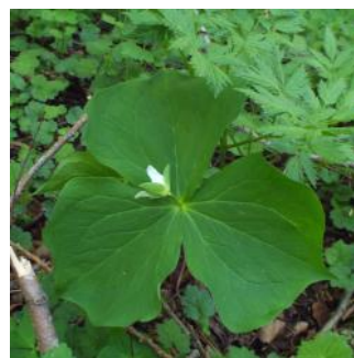
シロバナエンレイソウ