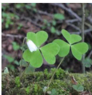
コミヤマカタバミ