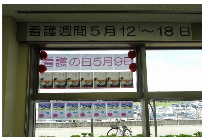
5月9日「北中看護の日」

ホールでは、当院の職員が「血圧測定」「看護・介護相談」などの健康チェックを行いました。また、看護体験コーナーでは手術器機を展示し、実際に使用する器機を見て頂き、約30名もの方が体験されました。